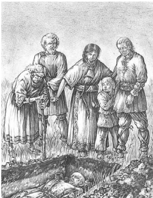
154. ábra ♦ Elképzelt avar temetés

811-re az avar kaganátus a széthullás szélére került: a területén különböző fejedelemségek jöttek létre, bizonyos részei a Karolingok, mások az óbolgárok fennhatósága alá kerültek. A Dunától délre eső területeken egy vazallusi avar államalakulat jött létre, amely a Karoling Birodalomhoz csatlakozott.