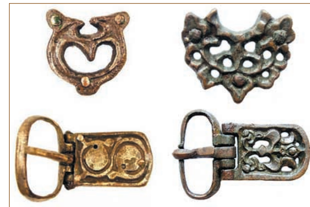
158. ábra ♦ Késő avar kori övcsatok és övdíszek

nyakláncok, sokszor huzalkarperecek, spirális drót- vagy lemezgyűrűk, ritkán a ruha mell-részét összefogó mellboglár. A korszak végére a nőknél is megszaporodnak a nyugati típusú viseleti tárgyak.