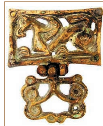
157. ábra ♦ A 156. ábrán látható övgarnitúra egyik övverete