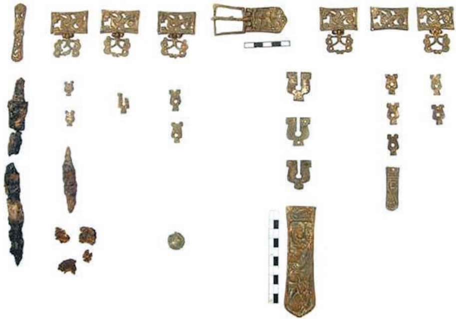
156. ábra ♦ Griffes-indás övgarnitúra. Az előkelő avar férfiak diszes öveget viseltek számos verettel, mellékszíjjal és nagy övszíjvéggel