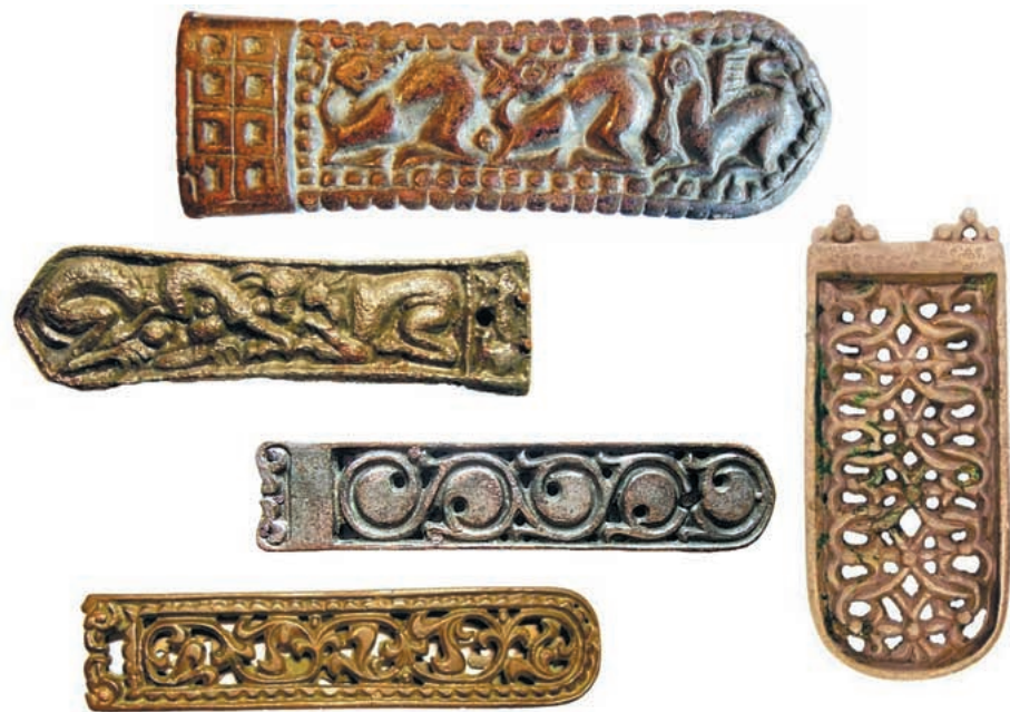
159. ábra ♦ Díszes késő avar kori nagy szíjvégek