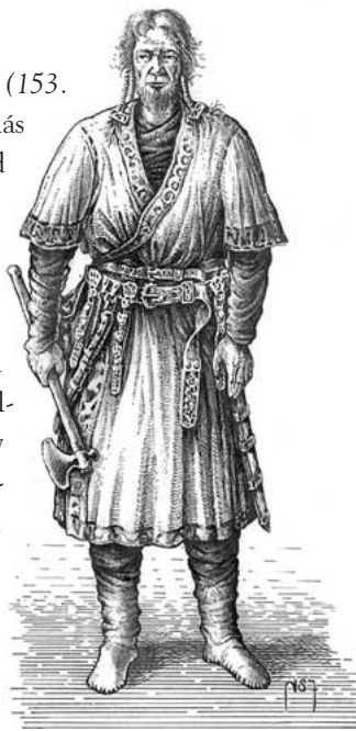
153. ábra ♦ Késő avar kori férfiviselet rekonstrukciója

A frank NAGY KÁROLY hatalomra kerülésével azonban elmúlt a békés időszak. NAGY KÁROLY hódító hadjáratai keretében 791-ben az avar kaganátusra támadt, és bár súlyos vereséget szenvedett, a támadás felszínre hozta az avar birodalom régóta meglévő belső feszültségeit: polgárháború tört ki a kagán és fővezére, a jugurru között. Így amikor NAGY KÁROLY 796-ban és 803-ban újabb támadásokat indított, már sikerrel járt. Tovább súlyosbította a helyzetet Krum bolgár kán, akitől az avarok szintén vereséget szenvedtek.